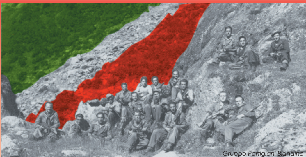
Gruppo Partigiani Blandino